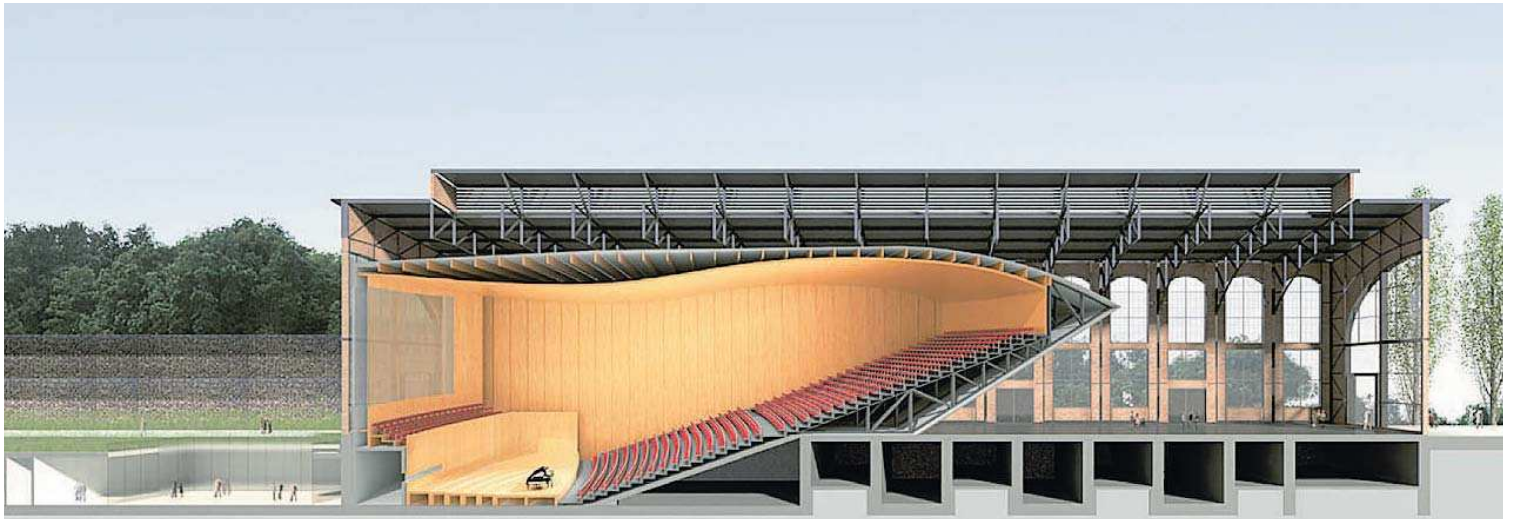
Das E-Werk von der Seite im Querschnitt: Der Konzertsaal wird in die Halle hineingebaut.