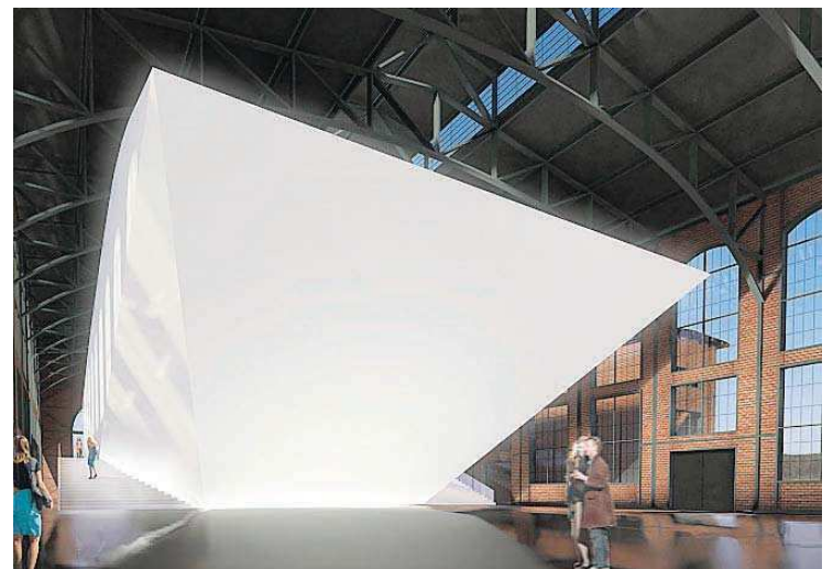
Der Konzertsaal, der ins E-Werk hineingebaut werden soll.