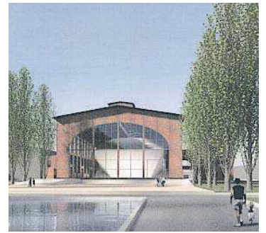
Das E-Werk, begrünt und hin- ter einer Wasserfläche.